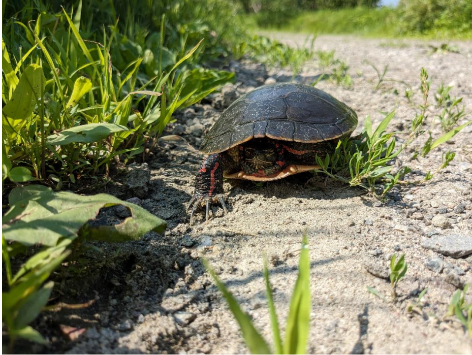
Tortue peinte