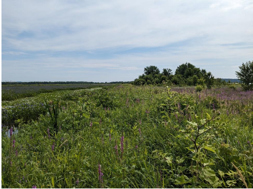
Marais aux Massettes