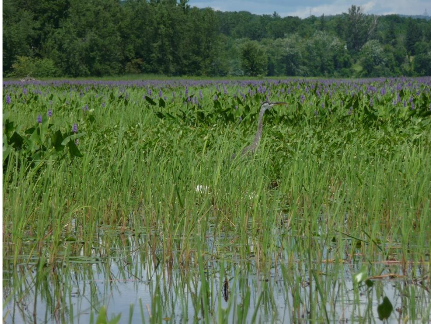
Grand héron